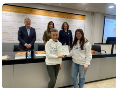
Reconocimiento de la Facultad de Farmacia de la UV por la labor desempeñada en la formación del alumnado, el 13 de junio