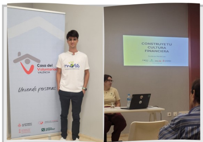
Charla "Construye tu cultura financiera", en la casa del voluntariado, Valencia 19 septiembre