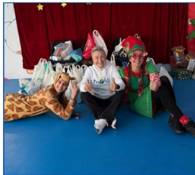
Participación en la carrera San Silvestre solidaria organizada por el colegio Maristas de Cullera, 19 diciembre