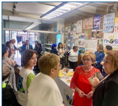
Jornada de puertas abiertas de MOS Solidaria, 30 abril