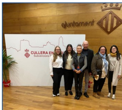
Firma del convenio con el Ayuntamiento de Cullera, 6 febrero