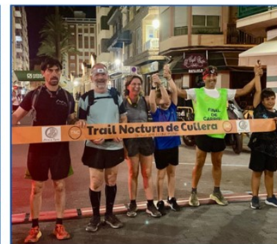
Trail Nocturn organizado por la Falla Taüt de Cullera, el 12 julio.