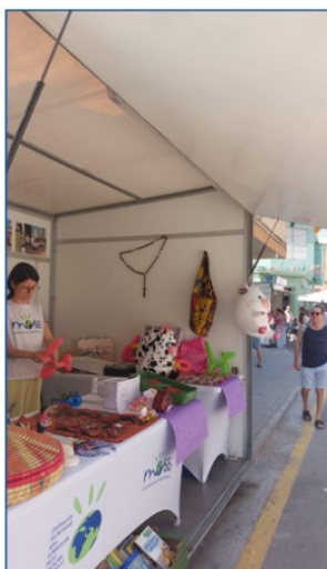
Feria del Tomate del Perelló, junio.