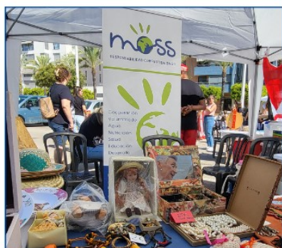
Jornada "Tots som Cullera" organizada por la falla Xúquer de Cullera, 28 septiembre.