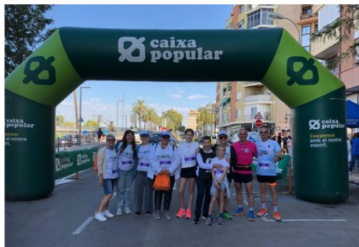
Participación en la carrera/caminata solidaria, en beneficio de Afacu, el 11 de Mayo