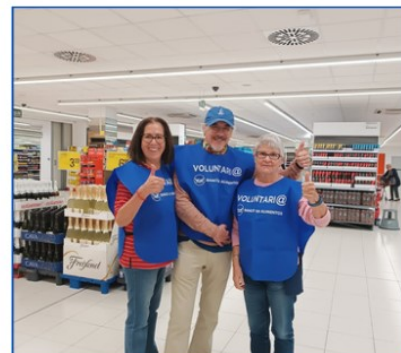
Participación en la Gran recogida de alimentos organizada por el Banco de alimentos el los supermercados de Cullera, el 23 de mayo y 8 de noviembre