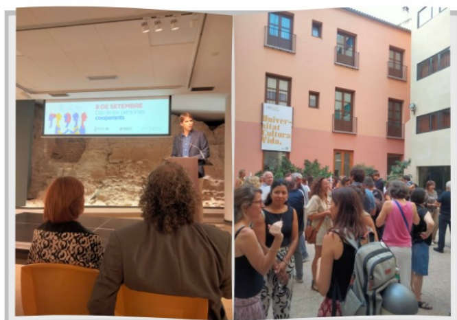
Día de las personas Cooperantes 8 Septiembre. Acto de celebración en el colegio Mayor Rector Peset, Valencia