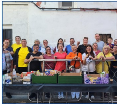
Chocolatá organizada por la asociación de festeros de San Antonio de Padua del Raval de Cullera, el 21 de octubre.