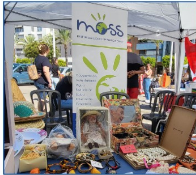
Jornada "Tots som Cullera" organizada por la falla Xúquer de Cullera, el 28 septiembre.